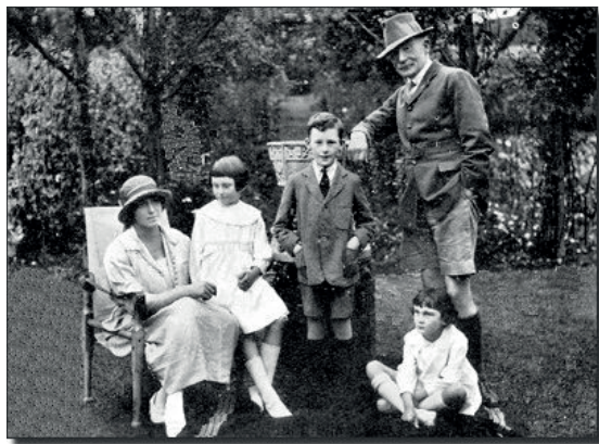
Pi-Pi családja körében

Ehhez írógépet is vett, ami akkor nagy újdonság volt. Nevet is kapott az írógép, mégpedig „bogár” lett a neve, amit valószínűleg a gyermekei adtak neki a kopogó hangja miatt.