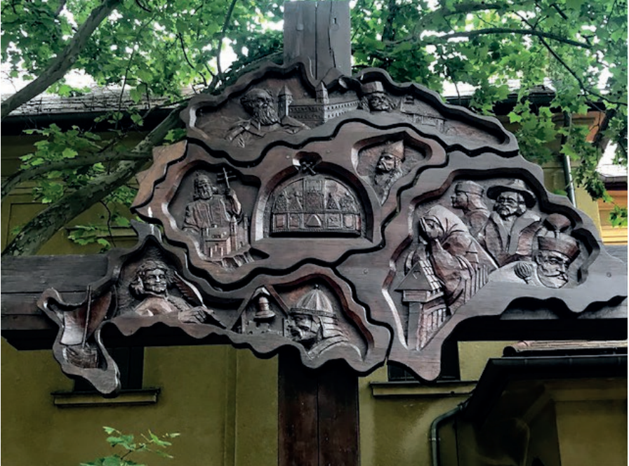
Csepel, Béke tér

„A haza tehát örökség, s egyszersmind eme örökségből fakadó helyzet is, ami a haza földjére és területére vonatkozik. Ám a haza fogalma még ennél is szorosabban kötődik azokhoz az értékekhez és szellemi tartalmakhoz, amelyek egy bizonyos nemzet kultúráját alkotják... amikor a lengyeleket megfosztották területeiktől és feldarabolták nemzetüket, akkor sem csökkent érzékenységük szellemi örökségük és őseiktől örökölt kultúrájuk iránt, sőt éppen hogy ekkor indult rendkívül dinamikus fejlődésnek.”