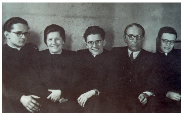
A családban mindhárom fiú, a papi hivatást választotta

8.28). Elsőéves kispap-társainak csoportvezetőjeként mondott búcsúbeszédet nekik az 1953–54-es tanév végén. Ebből idézünk: