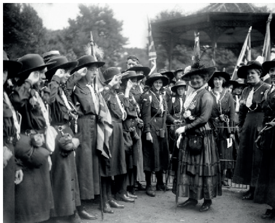
Agnes Baden-Powell cserkészlányok körében

Ehhez írógépet is vett, ami akkor nagy újdonság volt. Nevet is kapott az írógép, mégpedig „bogár” lett a neve, amit valószínűleg a gyermekei adtak neki a kopogó hangja miatt.