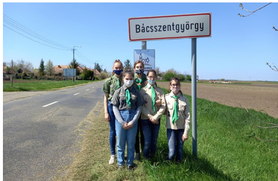
Bajai 567. sz. Mészáros Lázár cscs. egyik őrse

Miért Szent György? BiPi szobájának falait sok-sok Szent György-kép, ikon borította. A nehézségeket a biztos győzelem tudatával legyűró, magabiztos hőst állította példaképül a cserkészek elé: ünnepe a nemzetközi cserkészmozgalomban a cserkésznapja lett. Bár az utóbbi években Magyarországon a cserkésznapja májusra került át (vajon miért?), szükségesnek tartjuk, hogy az eredeti cserkésznap hagyományát megőrizzük, a tanúságtetés, példaadás napjává tegyük. Ezért hirdettünk erre az évre Szent György-napra olyan portyát, amelyen az őrök, rajok, csapatok valamilyen módon egy Szent György nevét viselő településre, templomhoz, forráshoz, barlanghoz mennek