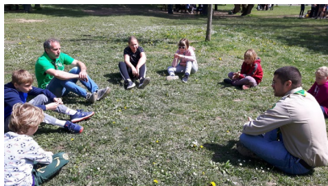
Zágráb, Zrínyi Miklós cscs.