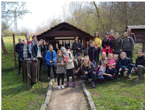
Eger 212. sz. Bornemissza Gergely cscs. Bátonyteremjén