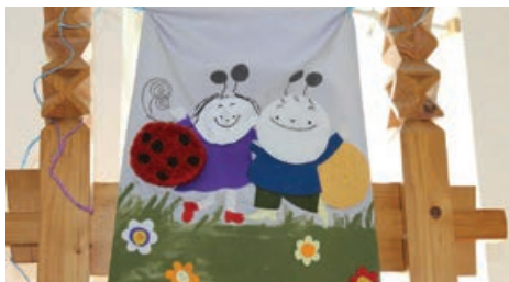
Tanyazászló 2013 tavaszán (készítették Lépes Lívía, Kozmér Kinga)