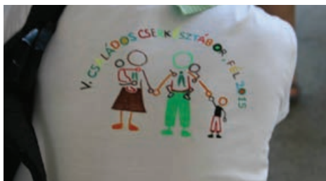
Családos cserkészpóló 2015-ben