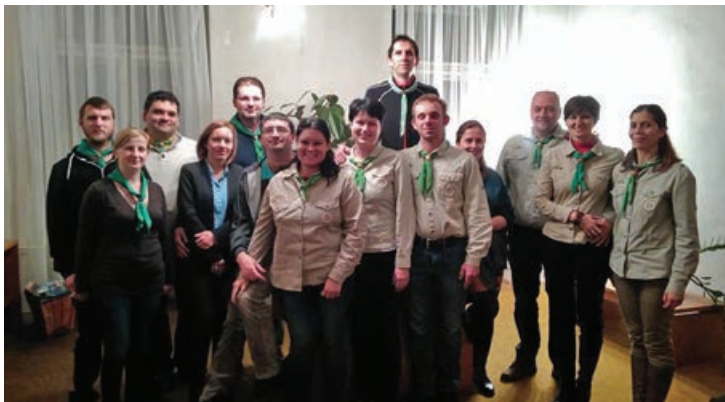
A kéziratot véglegesítésekor 2016. november 19-én Ipolyságon, a cserkészkonferencia során.