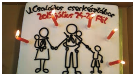
Táborozó családok tortája 2015-ben Félben